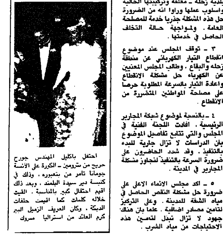
افراح جريج - تامر

افتتحت في كلية التربية في الجامعة اللبنانية/الفرع الاول معرض اشغال لطالبات الاربعة في كلية التربية.